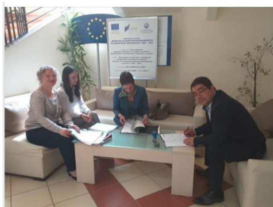
Местна Инициативна Група - МИГ- Кирково Златоград